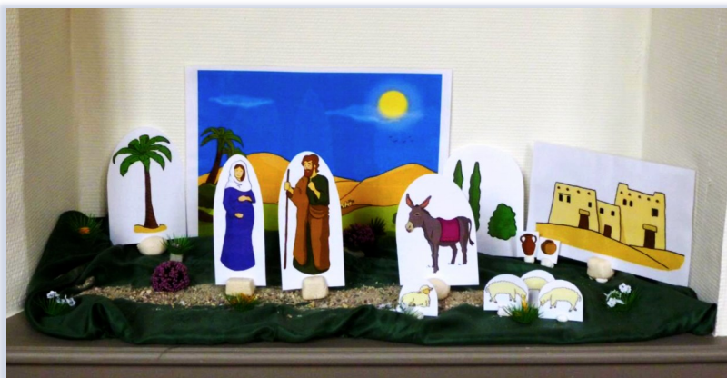
La montée vers Bethléem