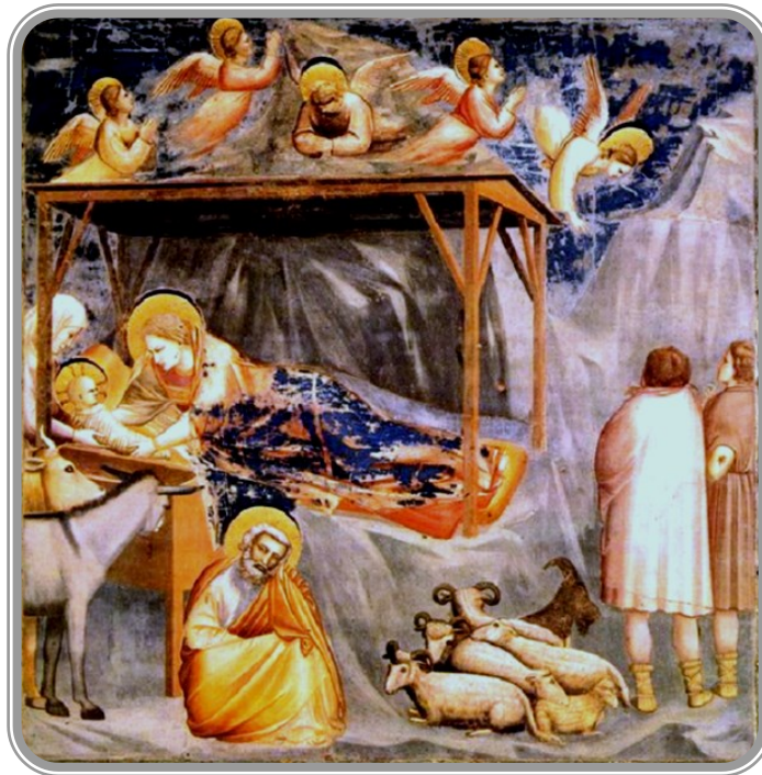
Giotto, 1303-1306, église de l'Arena, Padoue

Lorsque les anges eurent quitté les bergers pour le ciel, ceux-ci se disaient entre eux : « Allons jusqu'à Bethléem pour voir ce qui est arrivé, l'évènement que le Seigneur nous a fait connaître. » Ils se hâtèrent d'y aller, et ils découvrirent Marie et Joseph, avec le nouveau-né couché dans la mangeoire. Après avoir vu, ils racontèrent ce qui leur avait été annoncé au sujet de cet enfant. Et tous ceux qui entendirent s'étonnaient de ce que leur racontaient les bergers. Marie, cependant, retenait tous ces événements et les méditait dans son cœur.