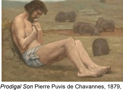
The Prodigal Son Pierre Puvis de Chavannes, 1879, National Gallery of Art