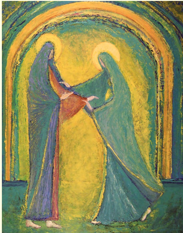
Macha Chmakoff, "Visitation à la voûte arc en ciel", huile sur toile, (81x65) www.chmakoff.com

« Mon âme exalte le Seigneur, exulte mon esprit en Dieu, mon Sauveur ! Il s'est penché sur son humble servante ; désormais tous les âges me diront bienheureuse. Le Puissant fit pour moi des merveilles ; Saint est son nom ! Sa miséricorde s'étend d'âge en âge sur ceux qui le craignent. Déployant la force de son bras, il disperse les superbes. Il renverse les puissants de leurs trônes, il élève les humbles. Il comble de biens les affamés, renvoie les riches les mains vides. Il relève Israël son serviteur, il se souvient de son amour, de la promesse faite à nos pères, en faveur d'Abraham et sa descendance à jamais. »