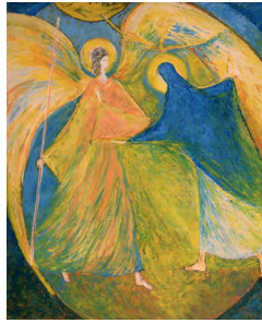
Macha Chmakoff, "L'Annonciation, Marie courant", huile sur toile, (81x65) www.chmakoff.com

Enceinte, et déjà lumineuse, elle porte en secret celui qui est la Bonne Nouvelle de l'amour de Dieu pour tous les hommes.