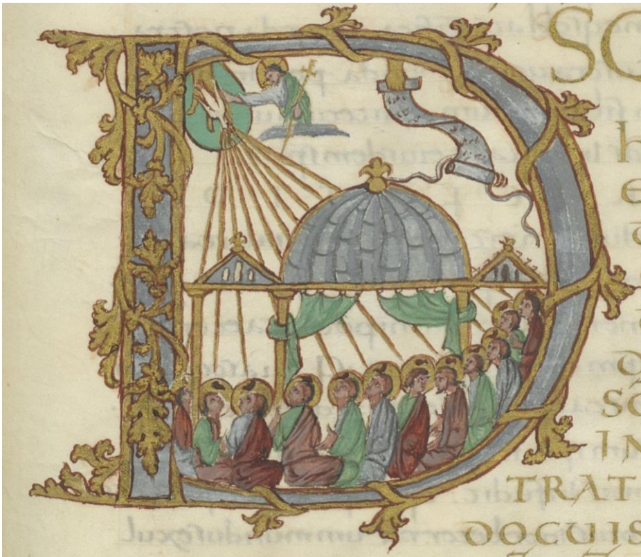
Initiale D du Sacramentaire de Drogon Manuscrit latin 9428BNF