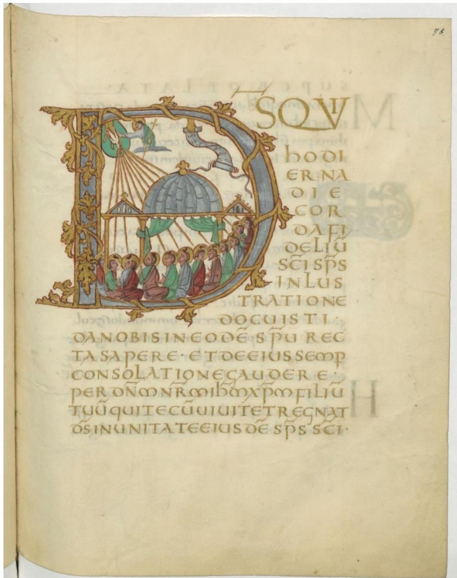
Image du sacramentaire de Drogon – source gallica.bnf.fr – bibliothèque nationale de France. Manuscrit latin 9428BNF : https://gallica.bnf.fr/ark:/12148/btv1b60000332/f165.image http://cetad.catholique.fr/meditation/514-l-esprit-nous-fait-connaître-dieu